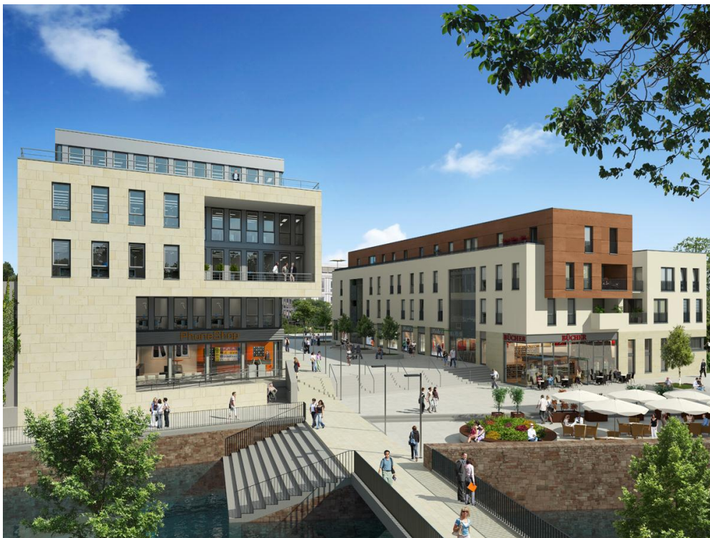
Das Quartier am Leinebogen aus Richtung Waageplatz.