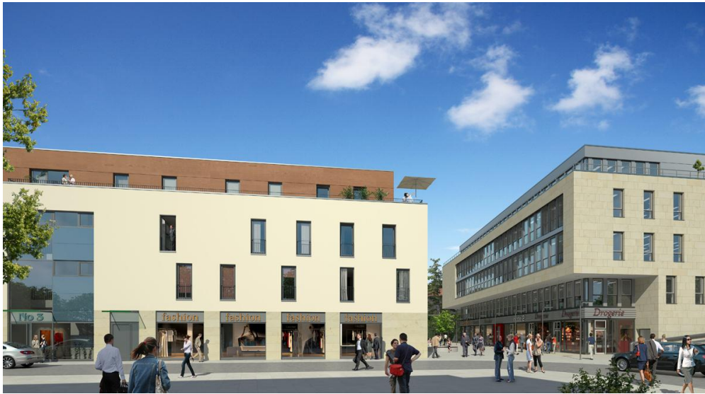
Das Quartier am Leinebogen aus Richtung Stumpfbiel.